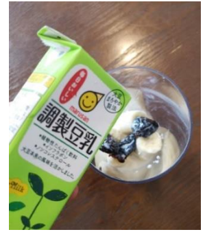
バナナ+ブルーベリー+豆乳