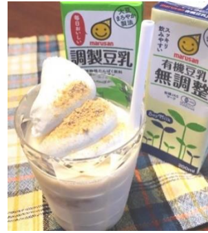
ソフトクリーム+きなこ+豆乳