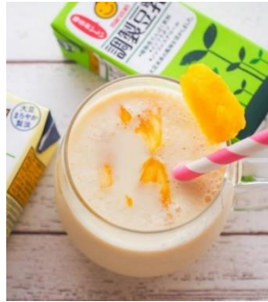
パイナップルジュース+豆乳