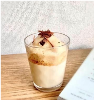
ダルゴナコーヒー