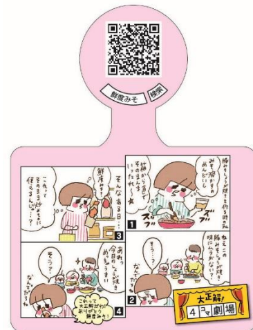
・やまもとりえさん描き下ろしデザイン