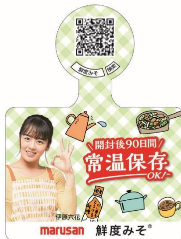
・伊原六花さんデザイン 2 パターン