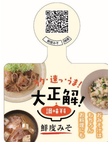
・「大正解調味料」ロゴデザイン 2 パターン