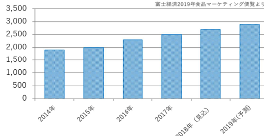
(百万円) ヨーグルト風デザート販売額推移 (メーカー出荷) 富士経済2019年食品マーケティング便覧より

富士経済の調査(ヨーグルト風デザート市場)によると、2015 年以降販売額の伸長率が右肩上がりです。2019 年は販売額 29 億円と予測されており、引き続き市場は延伸する見込みです。今後、さらなる市場活性化が期待されています。